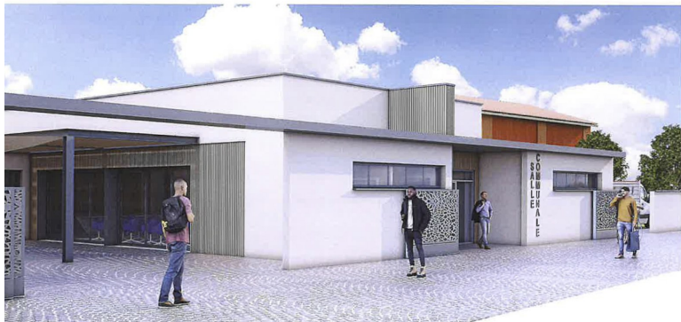
Vue de la future salle communale depuis l'impasse de la mairie