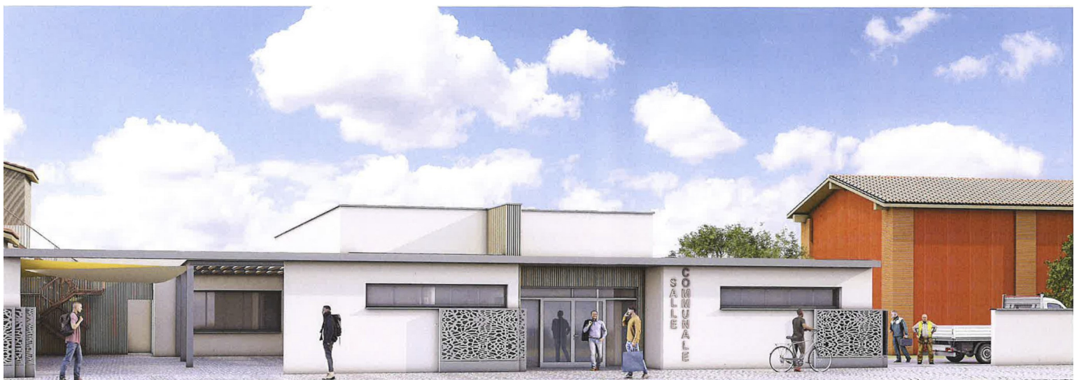
Vue de la future salle communale depuis l'impasse de la mairie